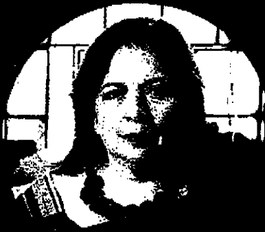
Betsabeé Romero (Mexican Artist)

เจ้าของผลงานจากนิทรรศการ 'To Dream Comes on Concentric Circle' กับประเด็นความสัมพันธ์ระหว่างพื้นที่สาธารณะและพื้นที่ของศิลปิน