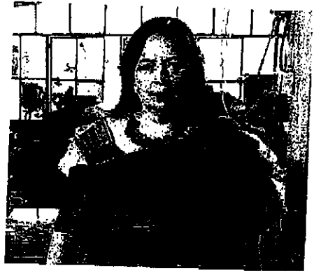
เบ็ธซาเบ โรเมโร่ (Betsabeé Romero, 1953 - )

เบ็ธซาเบ โรเมโร่ ศิลปินชาวเม็กซิกัน เกิดเมื่อปี พ.ศ. ๒๕๐๖ ณ นครหลวงเม็กซิโกซิตี ณ สหรัฐเม็กซิโก เธอสำเร็จการศึกษาทางด้านการศึกษา การสื่อสาร วิจารณ์ศิลป์และประวัติศาสตร์ศิลปะ จาก ฝรั่งเศสและเม็กซิโก