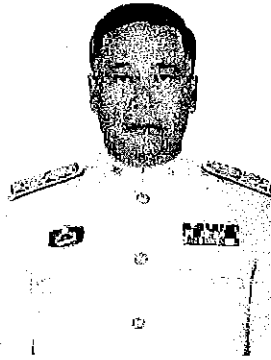
นายนภดล เทพพิทักษ์ อดีตเอกอัครราชทูต ณ เวียงจันทน์ สาธารณรัฐประชาธิปไตย ประชาชนลาว