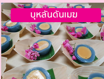
บุหลันตันเมฆ