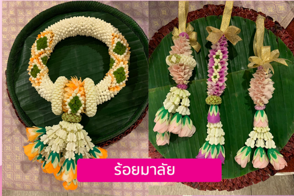
ร้อยมาลัย