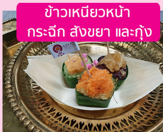
ข้าวเหนียวหน้า กระฉีก สังขยา และกุ้ง