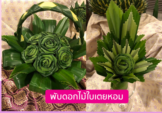
พับดอกไม้ใบเตยหอม