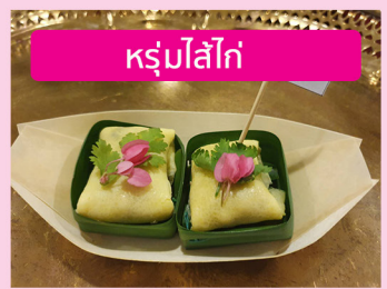
ห่อหมูใส่ไก่