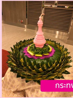
กระทงใบตอง