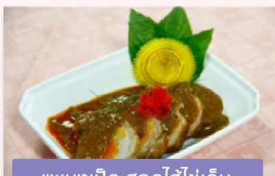
แพนงเปิด สอดไส้ไข่เค็ม