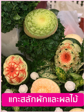
แกะสลักฟักและผลไม้