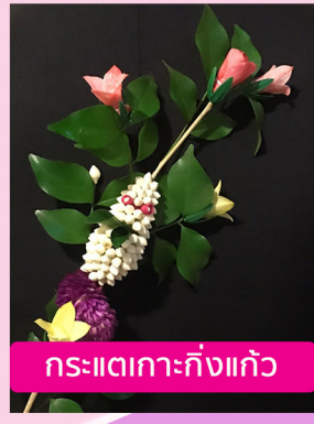
กระแตเกาทิ้งแก้ว