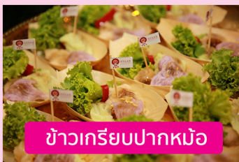
ข้าวเกรียบปากหม้อ