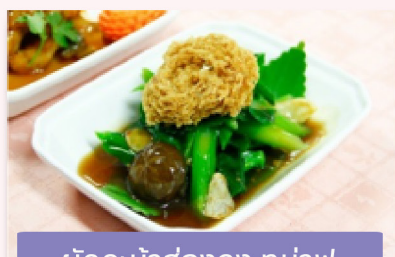
ผัดคะน้าฮ่องกง กู๋น่ายฟู