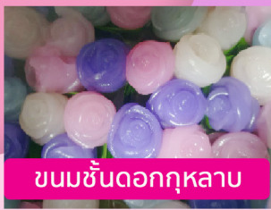
ขนมชั้นดอกกุหลาบ