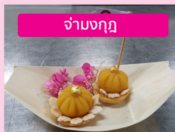
จ่ามงกุฎ