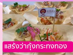
แสร้งว่ากุ้งกระทงทอง