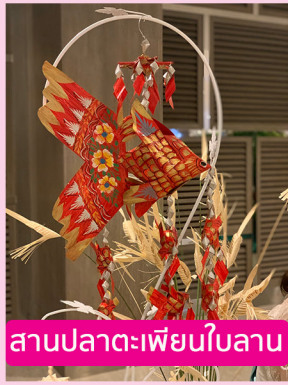
सानปลาตะเพียนใบลาน