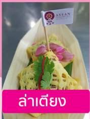
ล่าเตียง

มหาวิทยาลัยสวนดุสิต โดย คณะอาจารย์ บุคลากร และนักศึกษา ประกอบด้วย - โครงการอาหารกลางวัน 1 (ครัวสวนดุสิต) สำนักกิจการพิเศษ - ศูนย์ปฏิบัติการอาหารนานาชาติ โรงเรียนการเรือน - สาขาวิชาคหกรรมศาสตร์ โรงเรียนการเรือน - สาขาวิชาเทคโนโลยีการประกอบอาหารและการบริการ โรงเรียนการเรือน จำนวน 60 คน เข้าร่วมเป็นผู้ช่วยเชฟ Executive sous chef ในงานประชุมสุดยอดผู้นำอาเซียน ครั้งที่ 35 ระหว่างวันที่ 1- 4 พฤศจิกายน 2562 ณ ศูนย์แสดงสินค้าและการประชุม อิมแพค เมืองทองธานี