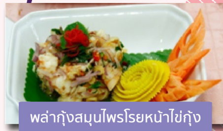
พล่ากุ้งสมุนไพรโรยหน้าไข่กุ้ง