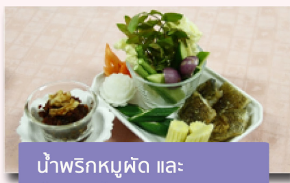
น้ำพริกหมูผัด และ ผักสด ปลาสดทอด