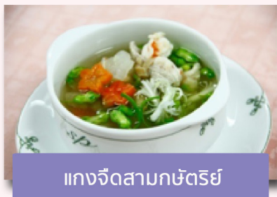
แกงจืดสามกษัตริย์