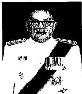
๕. นายธฤต จรุงวัฒน์ อดีตเอกอัครราชทูต ประจำกรุงอังการา สาธารณรัฐตุรกี