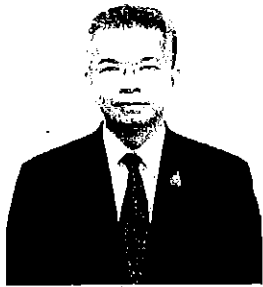
๑. นายรักษเกชา แฉ่ฉ่าย อดีตเลขาธิการสำนักงานผู้ตรวจการแผ่นดิน

หากท่านใดมีข้อมูล ข้อเท็จจริง และข้อคิดเห็นเกี่ยวกับบุคคลที่จะเข้ารับการสรรหา เป็นผู้สมควรได้รับการแต่งตั้งเป็นผู้ตรวจการแผ่นดิน