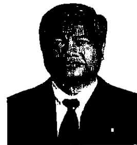
๖. นายสมชาย เจริญอำนวยสุข อดีตอธิบดีกรมส่งเสริม และพัฒนาคุณภาพชีวิตคนพิการ