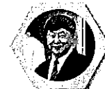
ศาสตราจารย์ ดร.นตพงษ์ บุญประดิษฐ์ ภาควิชาการศึกษาระดับปริญญาตรี