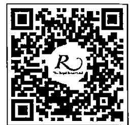
QR CODE สำหรับจองห้องพัก มหาวิทยาลัยศิลปากร

โทรศัพท์: ๐๒-๔๒๒-๙๒๒๒ โทรสาร : ๐๒-๔๓๓-๕๕๘๐ E-mail : rsvn@royalriverhotel.com