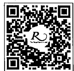
QR CODE สำหรับจองห้องพัก มหาวิทยาลัยศิลปากร