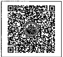
QR-Code เพื่อสมัครอบรม

โทรศัพท์: ๐๒-๔๒๒-๙๒๒๒โทรสาร : ๐๒-๔๓๓-๕๘๘๐ E-mail : rsvn@royalriverhotel.com