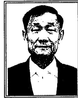
พลเรือเอก ประสาน สุขเกษตร (ด้านการส่งเสริมสิทธิและเสรีภาพของประชาชน)