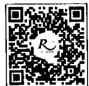
QR-Code สำหรับจองห้องพัก มาเรียริเวอร์

การสำรองห้องพัก ท่านสามารถจองห้องพักกับทางโรงแรมโดยสแกน QR-Code สำหรับจองห้องพัก หากท่านจองห้องพักภายหลังห้องพักอาจเต็มได้ และอาจจะไม่ได้ห้องพักราคาพิเศษ โรงแรมรอยัลริเวอร์ ๒๑๙ ซอยจรัญสนิทวงศ์ ๖๖/๑ แขวงบางพลัด เขตบางพลัด กรุงเทพฯ ๑๐๗๐๐ โทรศัพท์: ๐๒-๔๒๒-๙๒๒๒ โทรสาร : ๐๒-๔๓๓-๕๘๘๐ E-mail : rsvn@royalriverhotel.com