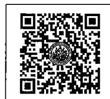
QR-Code เว็บไซต์

สำนักงานบริการวิชาการ มหาวิทยาลัยศิลปากร (ตลิ่งชัน) โทรศัพท์ ๐-๒๑๐๕-๔๖๘๖ ต่อ ๑๐๐๒๖๖