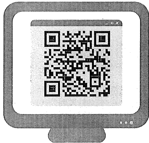
Poster ประชุมสัมพันธ