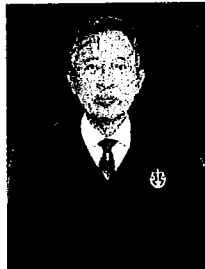
นายเกียรติภูมิ แสงศศิธร อธิบดีศาลปกครองนครราชสีมา