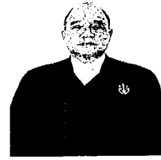
นายอาทร คุระวรรณ อธิบดีศาลปกครองสงขลา