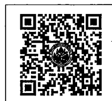
QR-Code เว็บไซต์