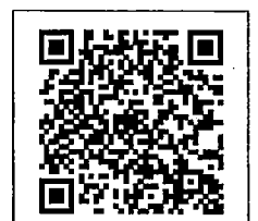
QR-Code เพื่อสอบถามข้อมูล