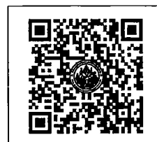
QR-Code เว็บไซต์